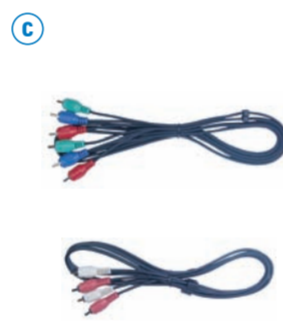
c DVD プレーヤーやケーブルテレビボックスなどの装置をコンポーネントケーブルおよびオーディオケーブルで接続します。 Connect devices such as a DVD player, or cable TV box using the component and audio cables.