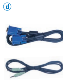
d VGA ケーブルおよびオーディオケーブルで、お使いのコンピュータと接続します。 Connect your computer using the VGA and audio cables.