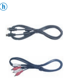
h DVD プレーヤーやビデオデッキ、ケーブルテレビボックスなどの装置を、S 端子ビデオケーブルおよびオーディオケーブルで接続します。 Connect devices such as a DVD player, video deck or cable TV box using the S-Video and audio cables.