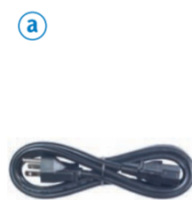
a AC 電源コード Power cord