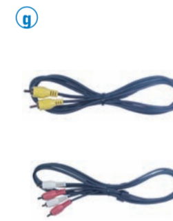
g DVD プレーヤーやビデオデッキ、ケーブルテレビボックスなどの装置を、コンジットケーブルおよびオーディオケーブルで接続します。 Connect devices such as a DVD player, video deck or cable TV box using the composite and audio cables.