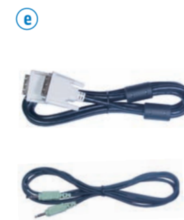
e DVI-D ケーブルおよびオーディオケーブルで、お使いのコンピュータと接続します。 Connect your computer using the DVI and audio cables.